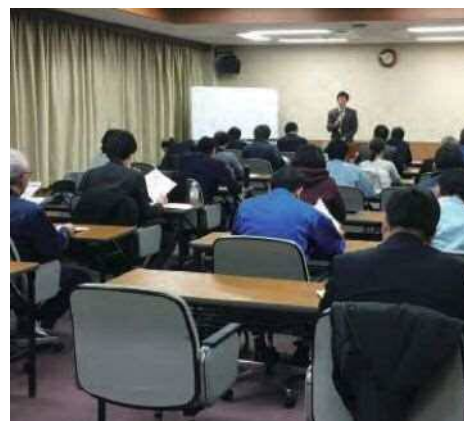
「ものづくり補助金無料個別相談会」の様子