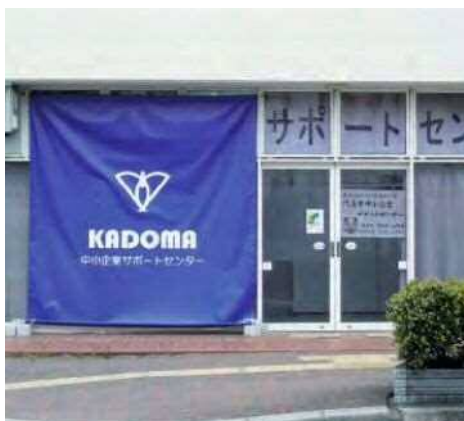
門真市中小企業サポートセンター